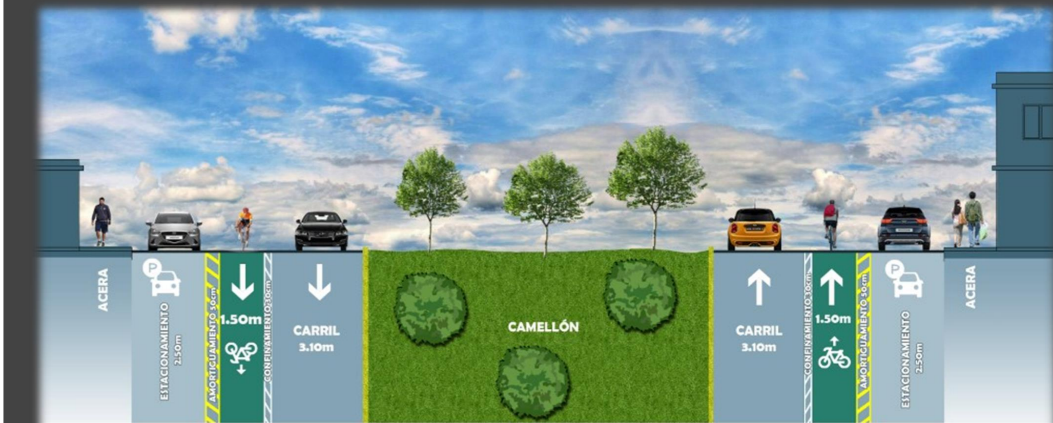
SECCIÓN 3 AV. RÍO NILO ENTRE AV. RÍO BRAVO Y RÍO ORINOCO

EQUIPAMIENTO: ELEMENTOS DE CONTENCIÓN (CONFIBICIS) SEÑALAMIENTO HORIZONTAL (DELINEADO DE FRANJAS) SEÑALAMIENTO VERTICAL